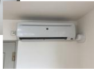
全室エアコン付き