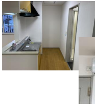
対面キッチンだから室内が広い