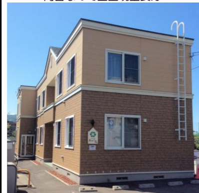
高台なので全室眺望良好